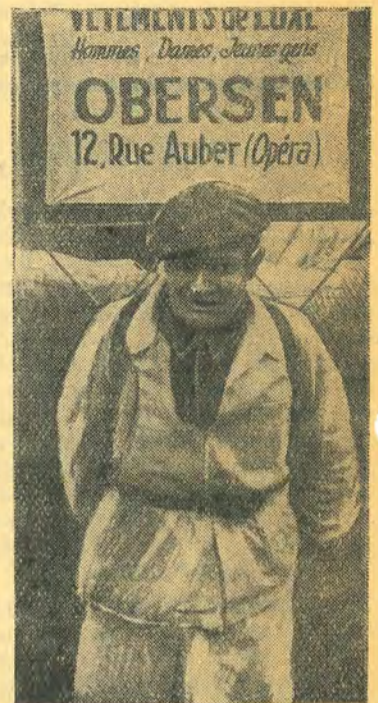
Человек — реклама