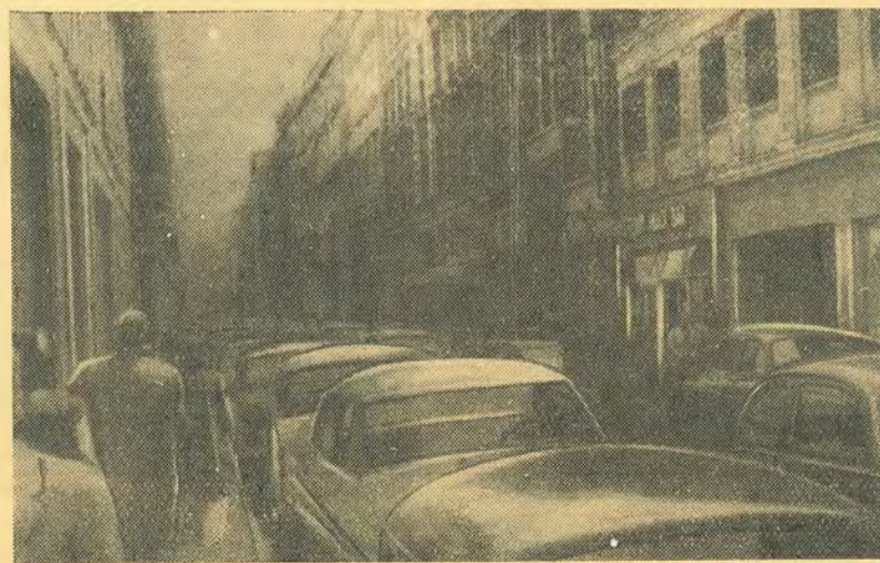
На одной из Парижских улиц.

узким улицам Латинского квартала. Все впечатления изложить в короткой статье невозможно. В Париже чувствуешь себя как то непринужденно. Мы не были предметом постоянного любопытных взглядов, как в Риме. А если и привлекали внимание, то обычно слышали теплые дружеские приветствия. Нас радушно принимали молодые прогрессивные журналисты, пригласив в первый вечер в